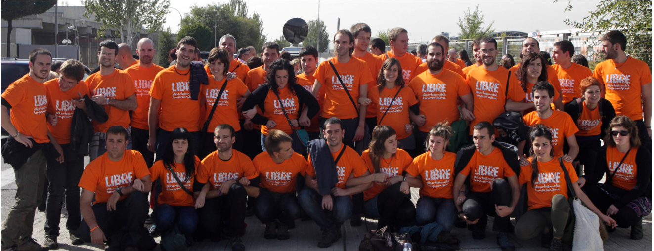
Foto : die wegen ihrer politischen Aktivitäten in der baskischen linken Jugendbewegung angeklagten vierzig Jugendlichen versammeln sich am ersten Prozesstag in Madrid vor dem Sondergericht Audiencia Nacional. Deren Anklage lautet auf Mitgliedschaft in der verbotenen Jugendorganisation SEGI, die in Spanien zur terroristischen Vereinigung erklärt wurde.